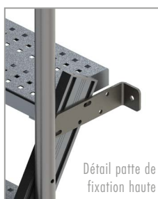
Détail patte de fixation haute