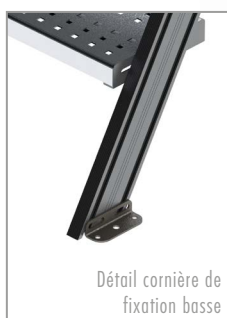
Détail cornière de fixation basse